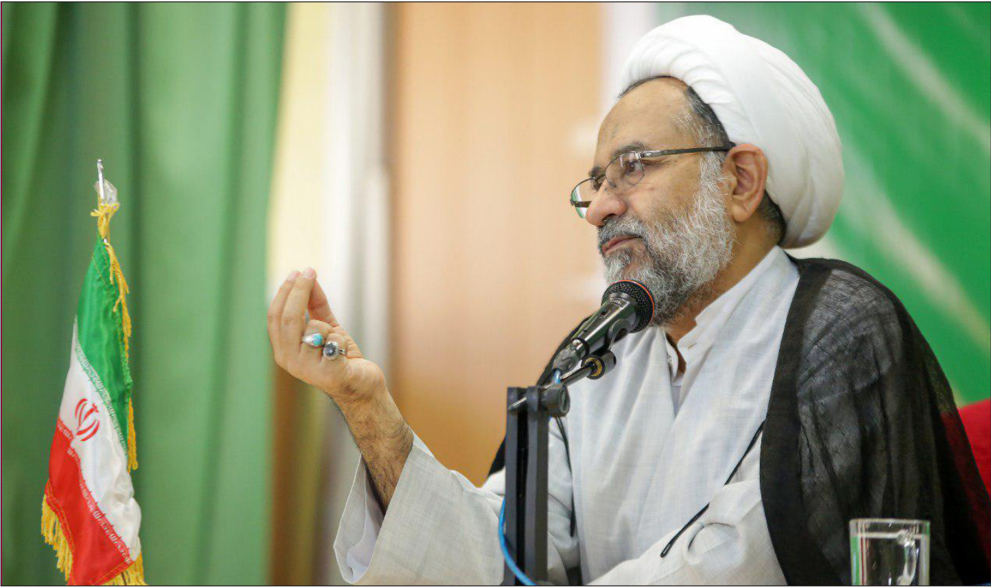
وزیر اسبق اطلاعات با حضور در قراگاه سازندگی خاتم الانبیا (ص):